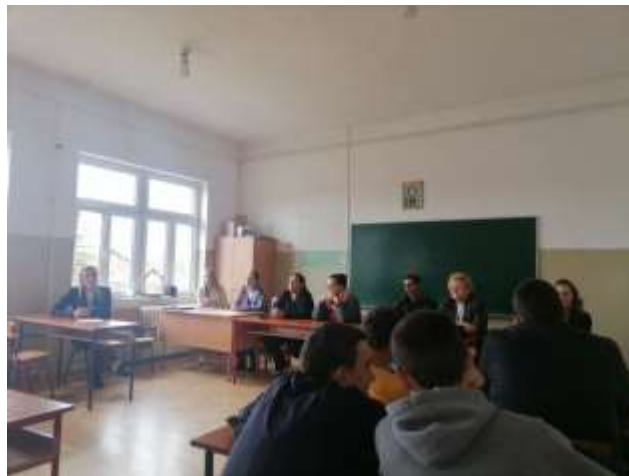
Представници занимања у нашој школи