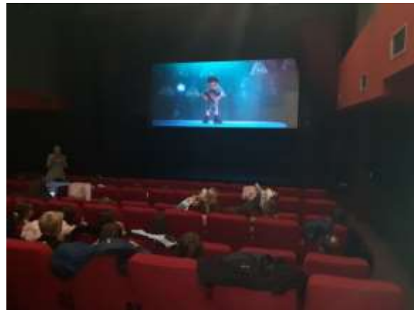
У оквиру „Обогаћеног једносменског рада“ ученици су посетили биоскоп