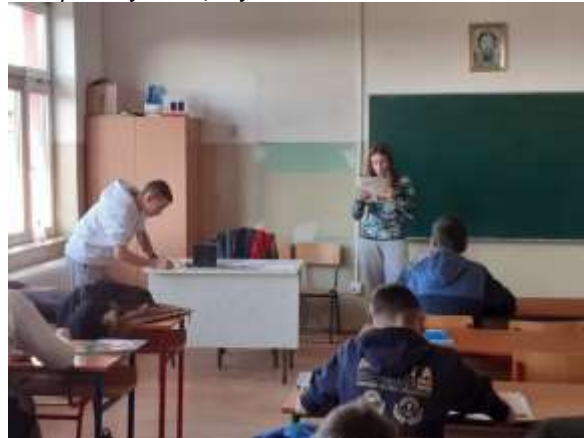
Реализован „Дан обрнутих улога“