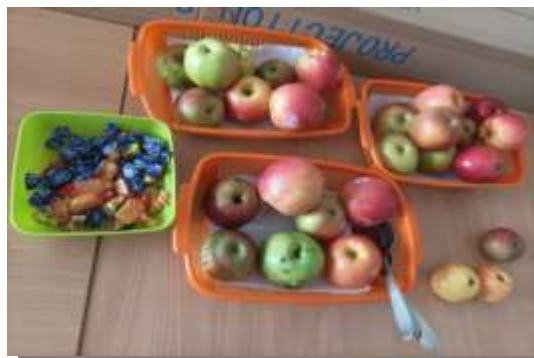
Обележен је Светски дан јабуке, 20. октобар