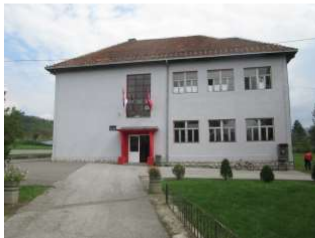
Основна школа „Браћа Рибар“, матична школа у Доњој Борини

Школска зграда матичне школе налази се поред магистралног пута Мали Зворник – Лозница, на десетом километру. У непосредној је близини поште, цркве и дома културе. Капацитет је 400 ученика.