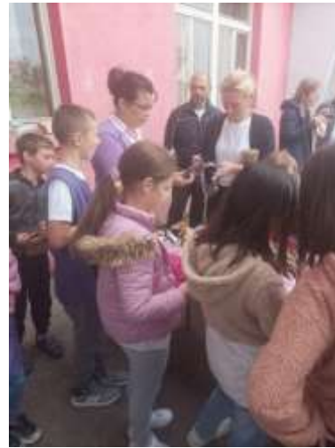
Хуманитарна продајна изложба под називом „Помоћ другу“