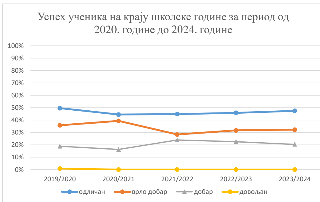
График: Извештај о успеху ученика на крају школске године за период од 2020. године до 2024. године.