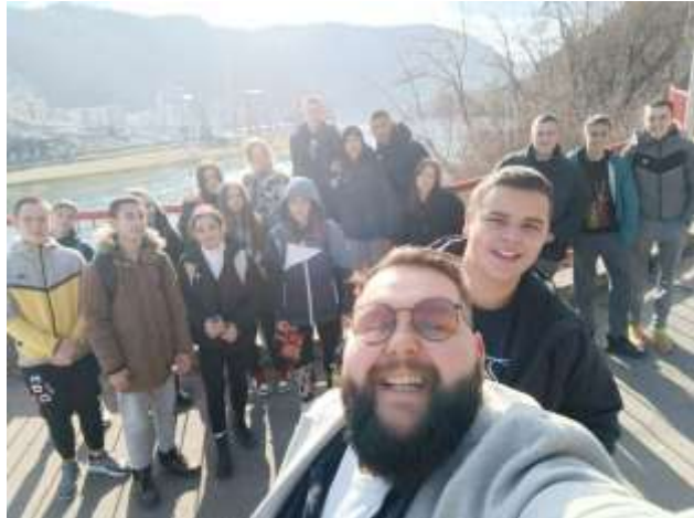
Посета подземном граду Карађорђевића