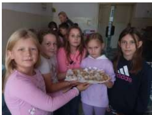
Обележен је Светски дан хране, 16. октобар

Следи неколико фотографија које осликавају рад изван редовне наставе.